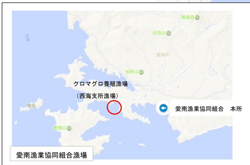
愛南漁業協同組合漁場