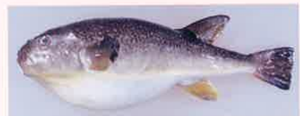
マフグ(東シナ海産、全長31.5cm)

(写真提供:「なめとら」、おさかな普及センター資料館;トラフグ・マフグ、独立行政法人水産総合研究センター)