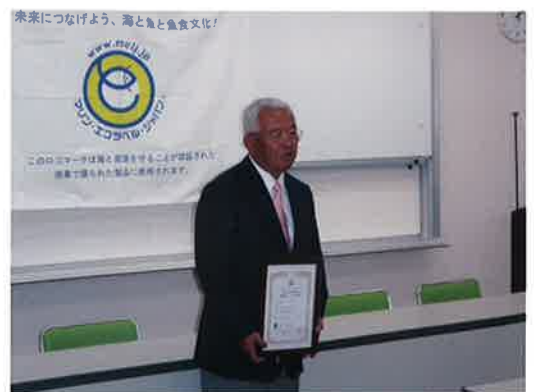
認証證書引渡式で決意表明を述べるカネシチ大石商店の大石代表