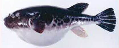
トラフグ(長崎県五島灘産、全長45.2cm)

Yamanoue, Y. and 9 authors (2009) Explosive speciation of Takifugu : another use of Fugu as a model system for evolutionary biology. Mol. Biol. Evol. , 26(3): 623-629.