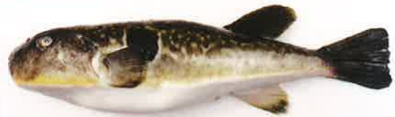
「なめとら」(トラフグ×マフグ)(北海道長万部産)