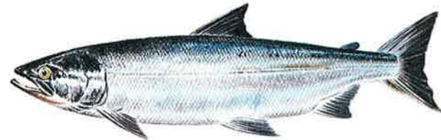
シロザケ(サケ) Oncorhynchus keta

日本の沿岸河川に遡上するのは、この種類が大部分で、ふ化放流の主力魚種。体長は5年で70cmになる。お正月の新巻きざけでおなじみ。すじこやイクラがとれる。