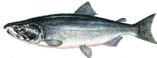
ギンザケ Oncorhynchus kisutch

日本に天然で回遊することなく、この種類の陸封型のヒメマス(体長約30cm、北海道ではチップという。)がいるだけ。体長は4年で60cmになる。産卵期になると魚体が紅葉のように紅くなるのでこの名がある。