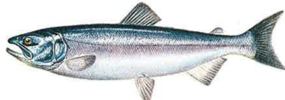
ベニザケ Oncorhynchus nerka

日本の沿岸河川に遡上するのは、この種類が大部分で、ふ化放流の主力魚種。体長は5年で70cmになる。お正月の新巻きざけでおなじみ。すじこやイクラがとれる。