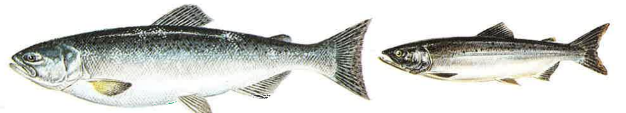
マスノスケ(キング・サーモン) Oncorhynchus tshawytscha カラフトマス Oncorhynchus gorbuscha

日本には回遊しない。サケ科の中で一番大きく体長1m以上になる。アメリカ・カナダに多く、スポーツフィッシングの対象としても有名。