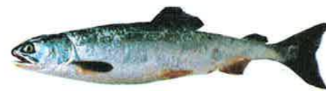
サクラマス Oncorhynchus masou

日本に回遊しないが、近年アメリカから卵を輸入してふ化し、宮城・岩手県下で海中養殖されている。体長は3年で70cmになる。美味。